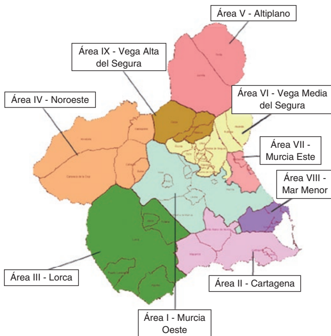
Figura 3. Áreas sanitarias de la Región de Murcia.

de los hospitales con ICPp y en el 63% de los pacientes de los hospitales comarcales, y a las de la red de asistencia el IAM de Minnesota con el protocolo de la Clínica Mayo 15 . En este protocolo se establece una estrategia farmacoinvasiva en la cual los tiempos totales de isquemia fueron de 103 minutos en los pacientes sometidos a trombolisis y de 278 minutos en los remitidos para ICPp (con una mediana de tiempo hasta la reperusión en el hospital comarcal de 181 minutos).